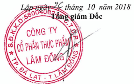
Đỗ Thành Trung