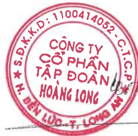
PHẠM PHÚC TOẠI