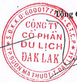
NGUYỄN THỊ SÁU