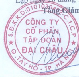
Đường Đức Hóa