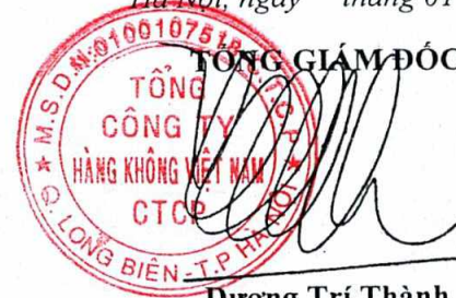
Dương Trí Thành