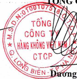
Dương Trí Thành