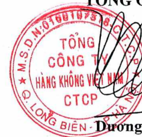
Dương Trí Thành