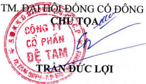
TRẦN ĐỨC LỢI