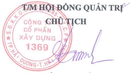
LÊ MINH TÂN

Quy chế này bao gồm 5 chương, 14 điều, được Hội đồng quản trị Công ty cổ phần Xây dựng 1369 dùng cho cuộc họp Đại hội đồng cổ đông thường niên năm 2020 của Công ty Cổ phần Xây dựng 1369 diễn ra vào ngày 27 tháng 03 năm 2020 và có hiệu lực thi hành ngay sau khi được Đại hội đồng cổ đông thông qua./.