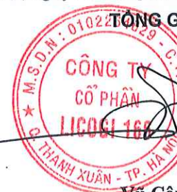
Vũ Công Hưng