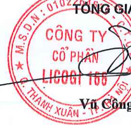
Vũ Công Hưng