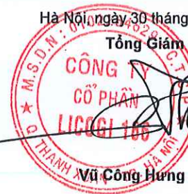
Vũ Công Hưng