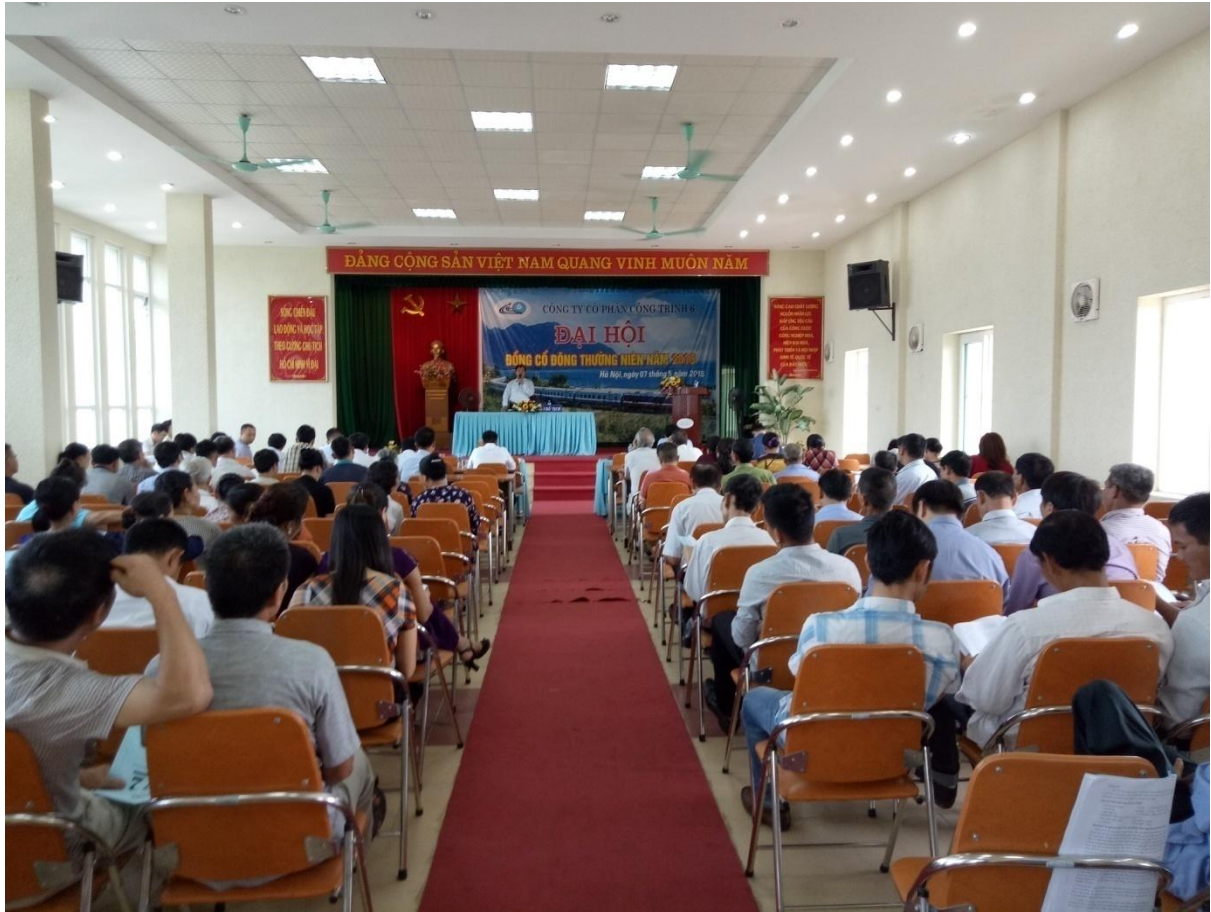
Tại Đại hội cổ đông thường niên năm 2019