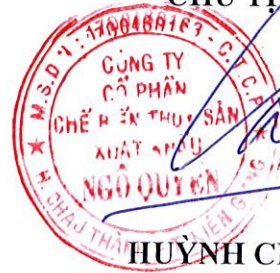
HUỲNH CHÂU SANG

Rạch giá, ngày 12 tháng 10 năm 2020 CHỦ TỊCH HĐQT