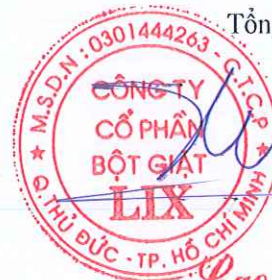
Cao Thành Tín