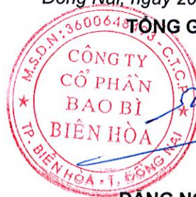
ĐẶNG NGỌC DIỆP