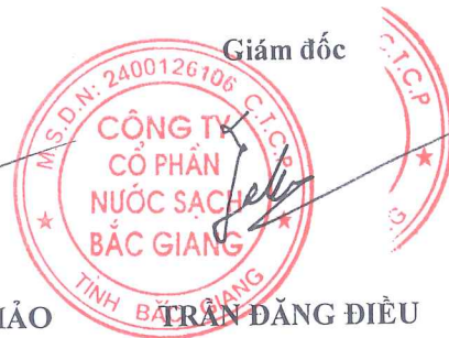
TRẦN ĐĂNG ĐIỀU