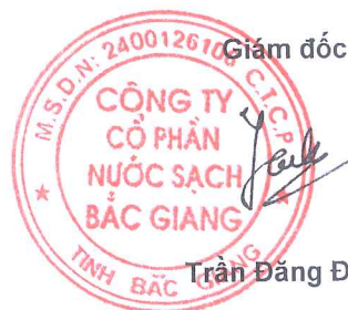
Trần Đăng Điều