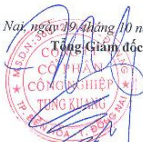
Lưu Chiên Hưng