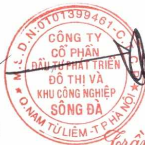
Trần Việt Dũng