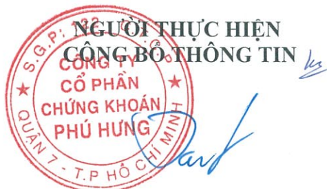
Ông CHEN CHIA KEN