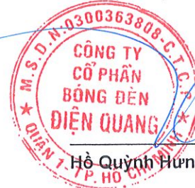
Hồ Quỳnh Hưng