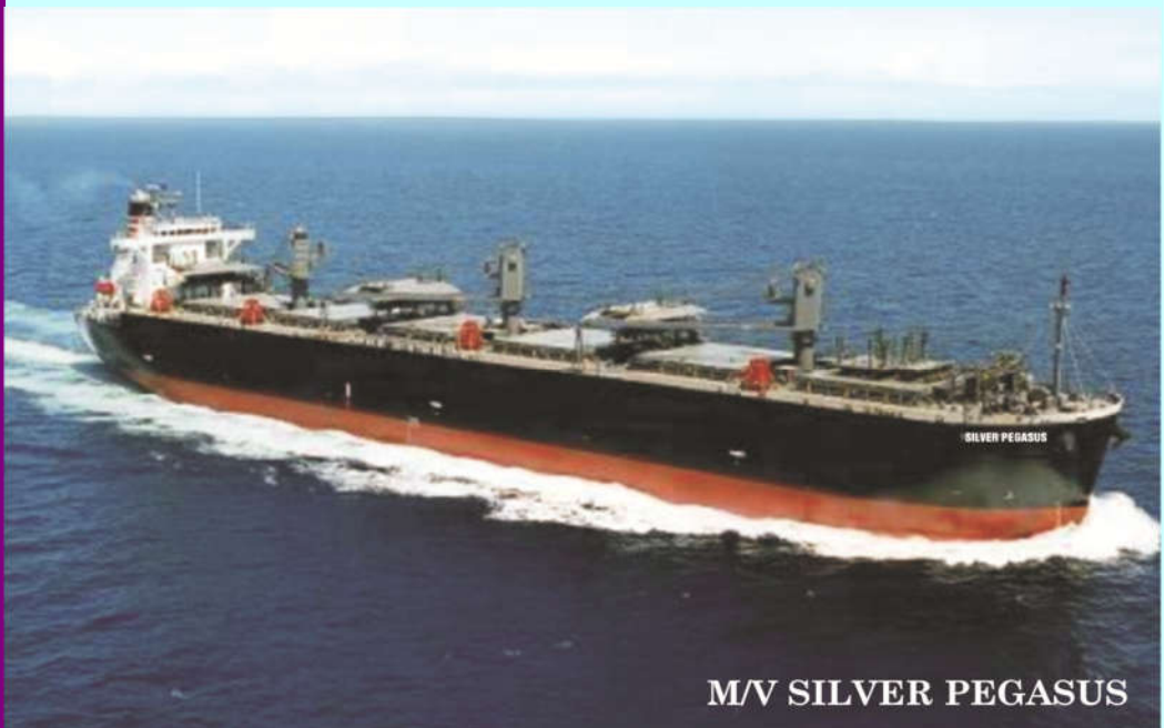
M/V SILVER PEGASUS