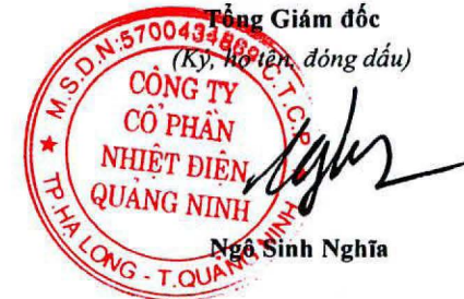
Ngô Sinh Nghĩa