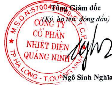
Ngô Sinh Nghĩa