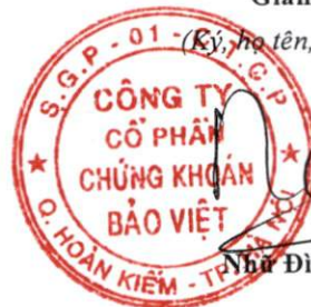
Nhà Đình Hòa