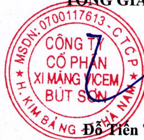
Đỗ Tiên Trình