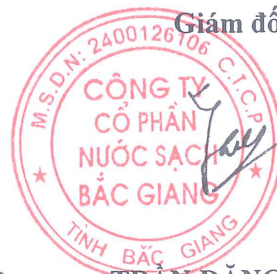
TRẦN ĐĂNG ĐIỀU