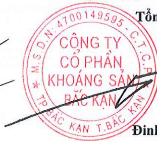
Đình Văn Hiến