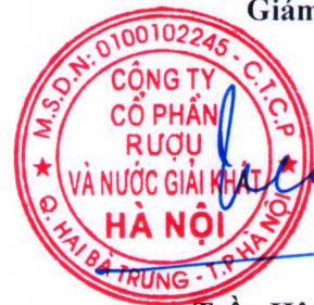
Trần Hậu Cường