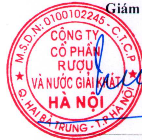
Trần Hậu Cường