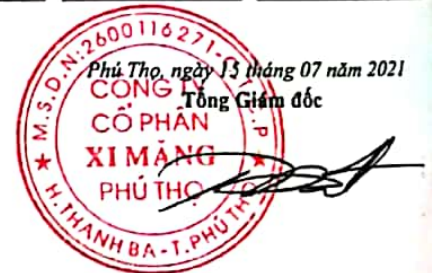
Trần Tuấn Đạt