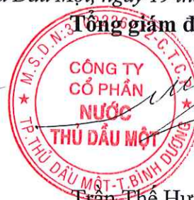
Trần Thế Hưng