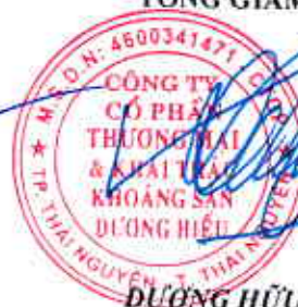
DUYNG HỮU HIẾU