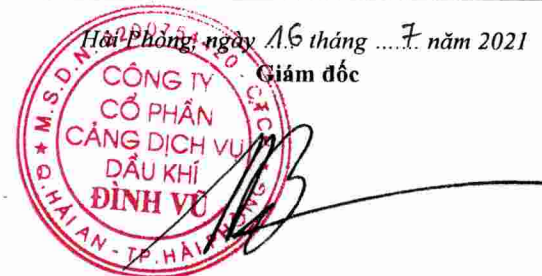
Đặng Kiến Nghiệp