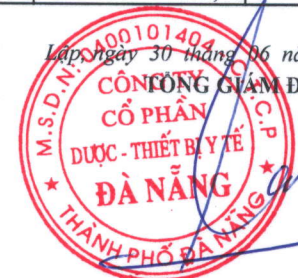
TỔNG VIẾT PHẢI