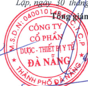
TỔNG VIẾT PHẢI