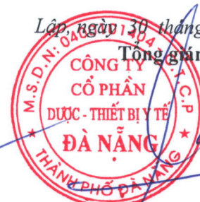
TỔNG VIẾT PHẢI