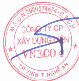
Hồ Hữu Phước