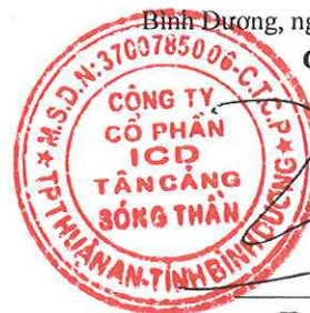
Trần Trí Dũng