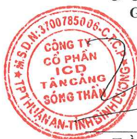
Trần Trí Dũng