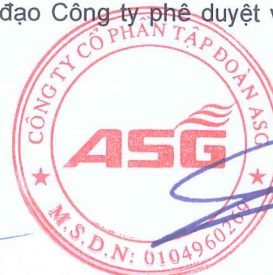
Dương Đức Tính Chủ tịch Hội đồng quản trị