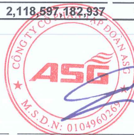
Dương Đức Tính Chủ tịch Hội đồng quản trị