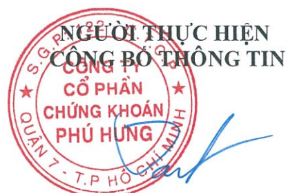
Ông CHEN CHIA KEN