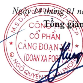
Trần Việt Hùng