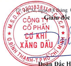
Đoàn Đắc Học