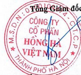
Trần Thị Thanh Bình

(Các thuyết minh từ trang 10 đến trang 38 là bộ phận hợp thành của Báo cáo tài chính hợp nhất này)