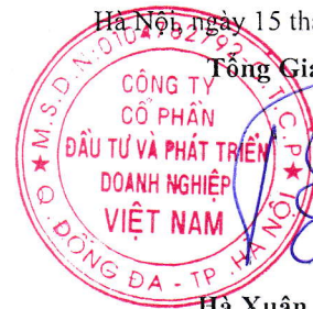
Hà Xuân Trường