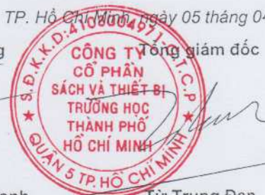
Từ Trung Đan