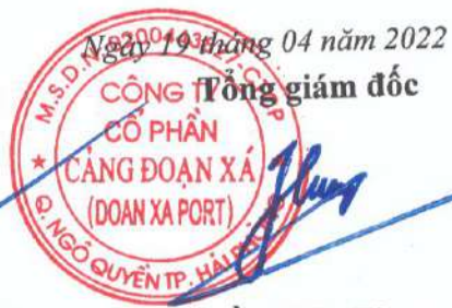
Trần Việt Hùng