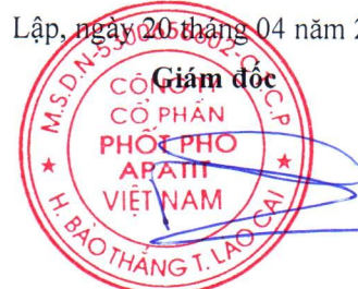
Đặng Tiến Đức