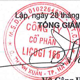
Vũ Công Hưng