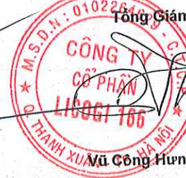
Mũ Công Hưng