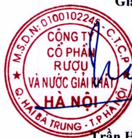
Trần Hậu Cường