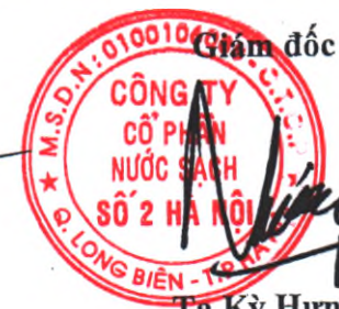
Tạ Kỳ Hưng