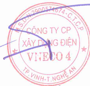
Hồ Hữu Phước