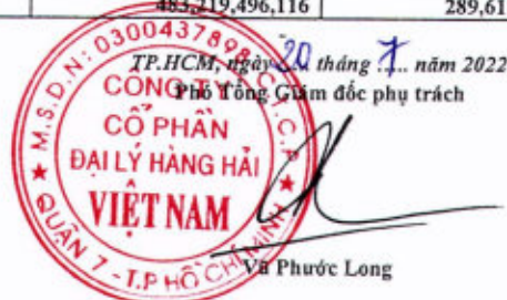
Võ Phước Long