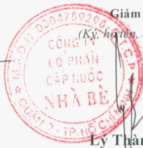
Lý Thành Tài