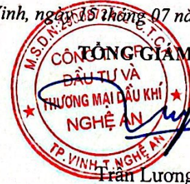
Trần Lương Sơn