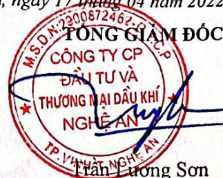
Trần Lương Sơn