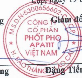
Đặng Tiến Đức