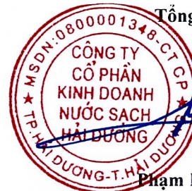
Phạm Minh Cường

(Các thuyết minh từ trang 6 đến trang 27 là bộ phận hợp thành của Báo cáo tài chính giữa niên độ này)