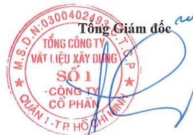
Cao Trường Thụ